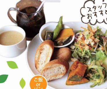
スタツ め おす

アボ豚ステーキ 1,000円 (税込) まぐろの中落ち丼 950円 (税込) 豚バラココナッツカレー 950円 (税込)