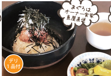
まぐろは オーナー一家 魚屋直送