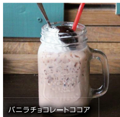
バニラチョコレートココア