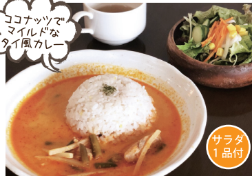
ココナッツで マイルドな タイ風カレー