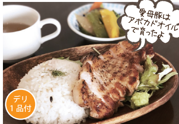
愛母豚は アボカドオイル で旨ったよ