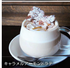
キャラメルアーモンドラテ