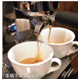
本格エスプレッソ